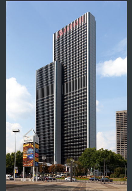
Westend Gate Frankfurt

Das gelingt uns mit einem breit aufgestellten Team aus Objektplanung, Projektmanagement, Bauleitung, TGA-Expertinnen und -Experten sowie kaufmännischen Fachkräften. Wir vereinen alle Gewerke und setzen Innen-Um- und -Ausbau-Projekte schnell und effizient um. Dabei haben wir sowohl den Kundennutzen als auch den Nachhaltigkeitsaspekt im Fokus und bringen beides in Einklang.