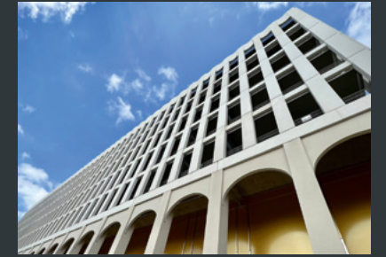
© Buhlmann Immobilien-Gesellschaft mbH/ Fernbusterminal Bremen

Ob schranken- und berührungslose Park- und Zugangstechnik, E-Ladeinfrastruktur oder Mobilitäts-App: Unsere Lösungen sind flexibel, durchdacht und an der Zukunft der Mobilität orientiert. Wir begleiten Sie über den gesamten Lebenszyklus Ihrer Parkimmobilie – individuell, zuverlässig und mit ganzheitlichem Blick für alle Herausforderungen.