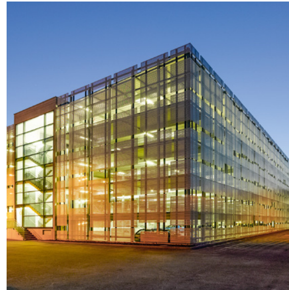
Bürogebäude, Hallen, Retail, Parkhäuser