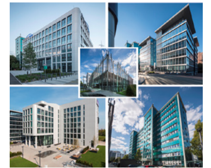
© Arminius Kapitalgesellschaft mbH/ Campus Eschborn

Unser unternehmenseigener technischer Service bietet Ihnen fachliche Expertise, wann und wo Sie sie brauchen: zu jeder Uhrzeit, an 365 Tagen im Jahr, bundesweit. Flexible Strukturen und ein digitales Serviceportal sorgen für eine hohe Transparenz. Damit garantieren wir einen optimalen Betrieb Ihrer Immobilie.