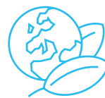
Ressourcenschonende nachhaltige Bewirtschaftung