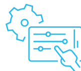
Professioneller InbetriebnahmeService und Start-Up-Phase