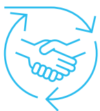
Ganzheitliche Beratung und Betreuung